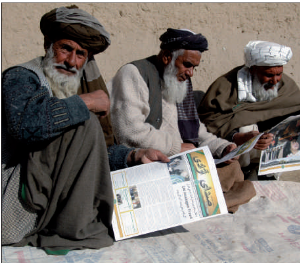
Des responsables locaux afghans lisent un journal édité par les « Psyops » français.

Les « Psyops » disposent de leurs propres journaux, d'une station de radio, « Radio Omid », de haut-parleurs. Ils impriment des tracts, font parfois des sondages sur la popularité des troupes lors